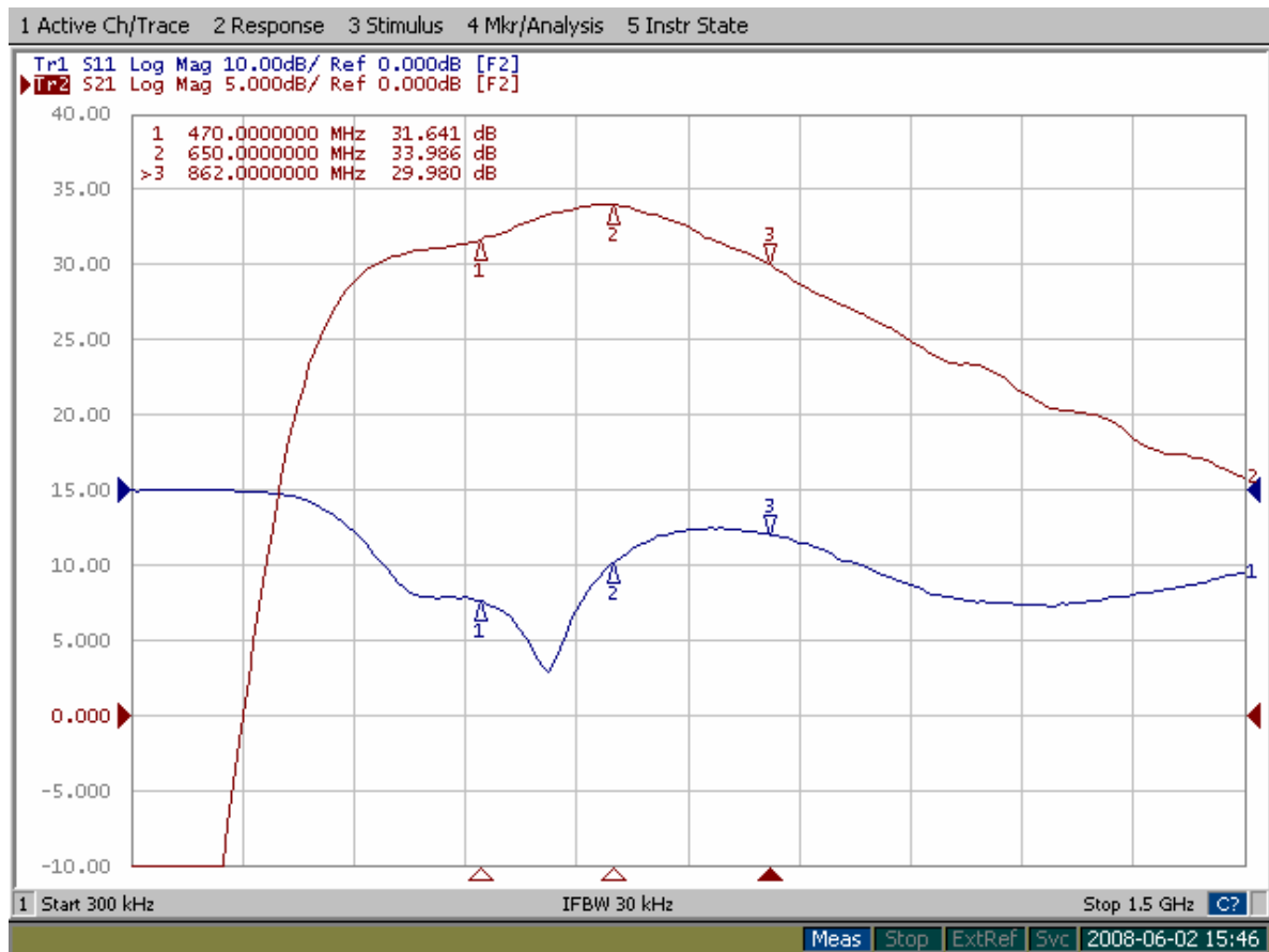
Sobituse (S11) ja ülekande (S21) karakteristikute näidis.