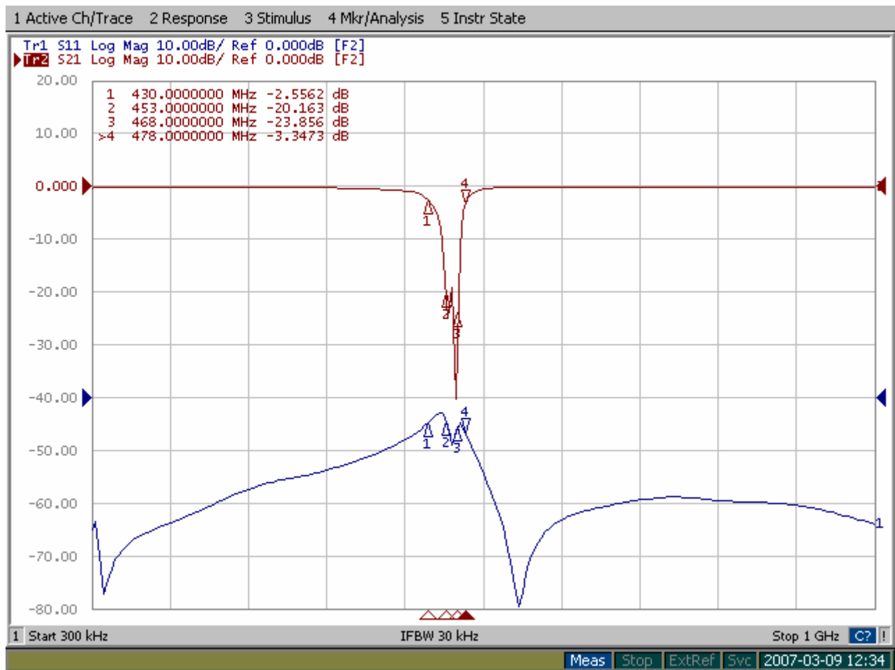
Joonis 2. Ülekandekarakteristik S21 ja sobitustegur S11; 300kHz - 1GHz